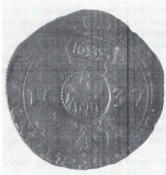
«Ефимок с признаком»

Рассмотрите изображение монеты и выполните задания 5.1 и 5.2